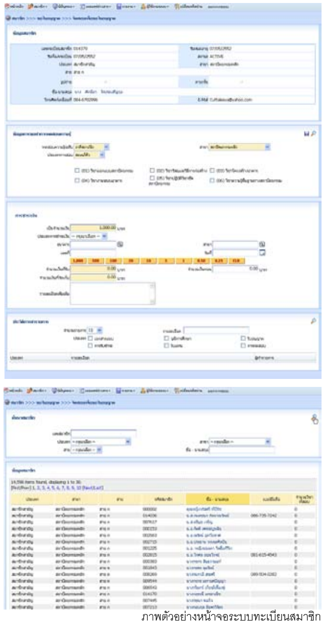
ภาพตัวอย่างหน้าจอระบบทะเบียนสมาชิก