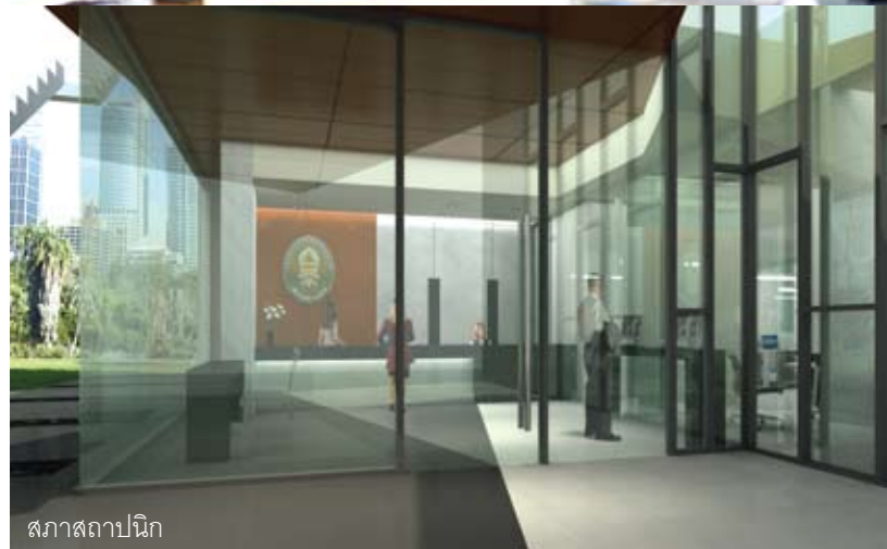
สภาสถาปนิก

เล็ก ดังนั้นในส่วนนี้เราจะไม่มีปัญหาเรื่องของคนสักเท่าไร แต่จะมีหลักในการบริหารส่วนนี้คือ การใช้คนให้เหมาะกับงาน การทำงานเป็นทีม การให้ความสำคัญเคารพต่อผู้มีอาวุโสกว่าเสมอ