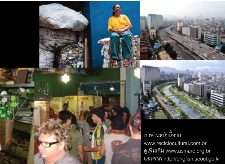
ภาพในหน้าจากร www.recicloccultural.com.br ดูเพิ่มเติม www.asmare.org.br และจาก http://english.seoul.go.kr

แลกเปลี่ยนความรู้และทำกิจกรรมร่วมกันด้วย คนทำงานยังได้รับส่วนแบ่งที่เป็นธรรมขึ้นจากการเก็บขยะรีไซเคิล ช่วยสร้างรายได้ที่เพิ่มขึ้นบวกกับสร้างความมั่นใจทางจิตใจให้คนเก็บขยะเกิดความ